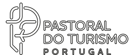
UTILIZAÇÃO EM OUTLINE