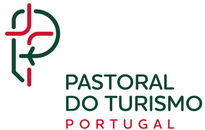
DESLOCAÇÃO DE ELEMENTOS